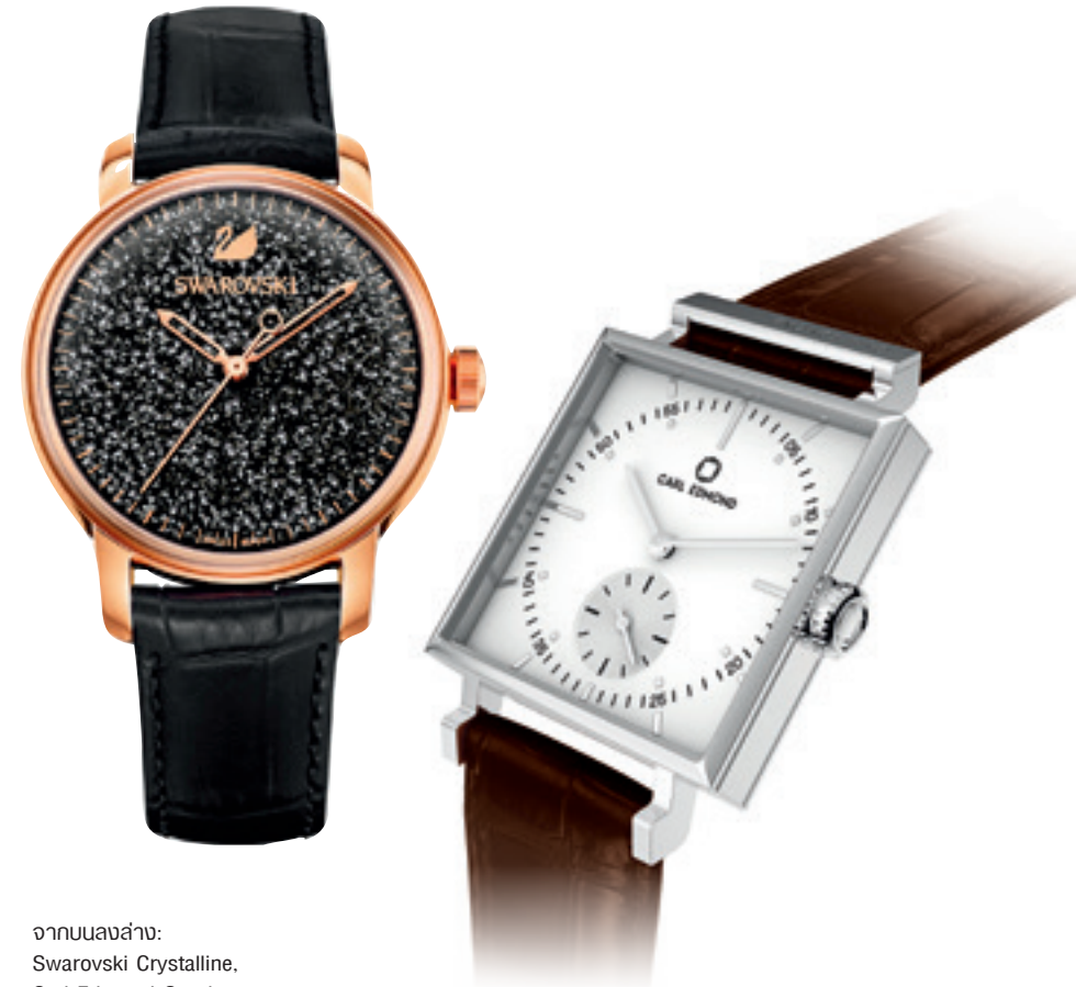
จากบนลงล่าง: Swarovski Crystalline, Carl Edmond Granit 2017, Badollet Ivresse