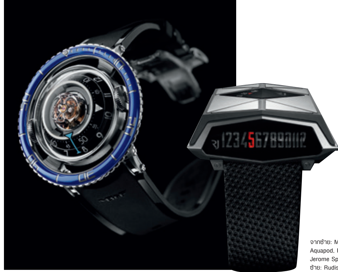
จากซ้าย: MB&F HM7 Aquapod, Romain Jerome Spacecraft 711A ซ้าย: Rudis Sylva RS16

วันนี้ เขาสวมนาฬิกาเรียบของ FP Journe “เพราะส่วนตัวผมชอบความคลาสสิกครับ”