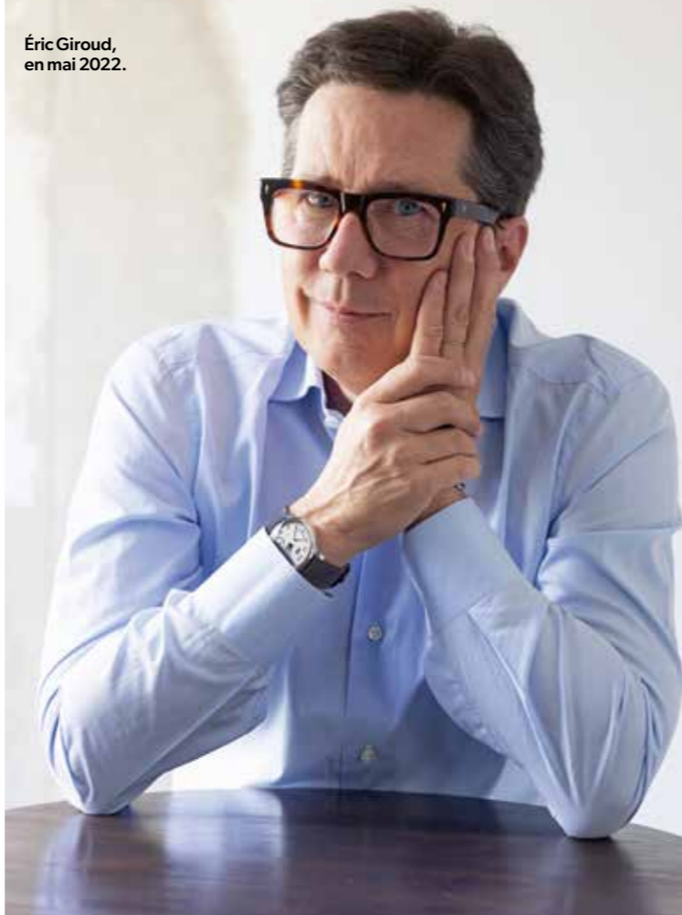
Éric Giroud, en mai 2022.