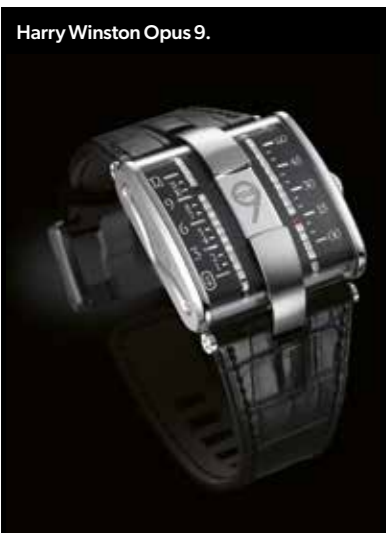
Harry Winston Opus 9.