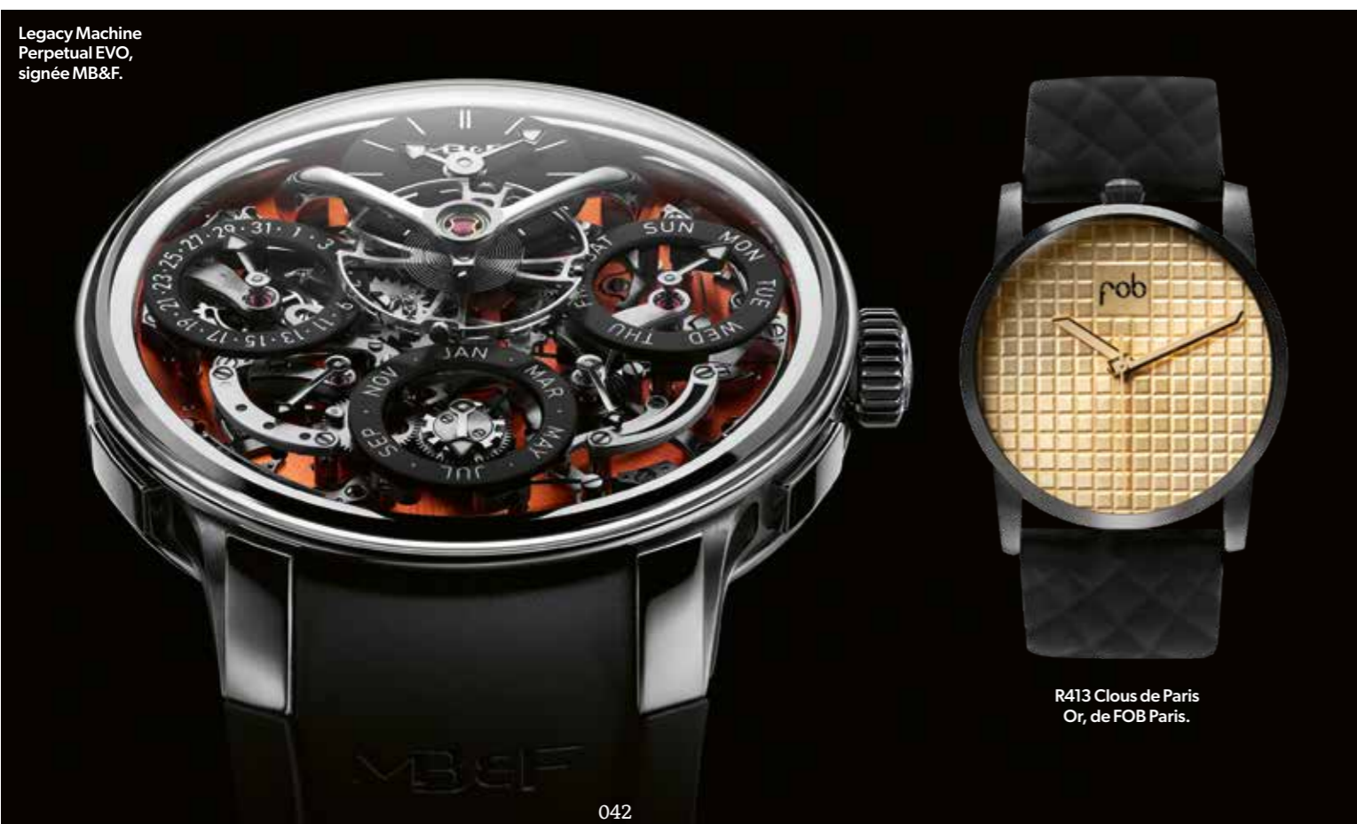
Legacy Machine Perpetual EVO, signée MB&F.

« Au final, je ne fais que des montres que l'on peut porter. Le reste, c'est du commerce. »