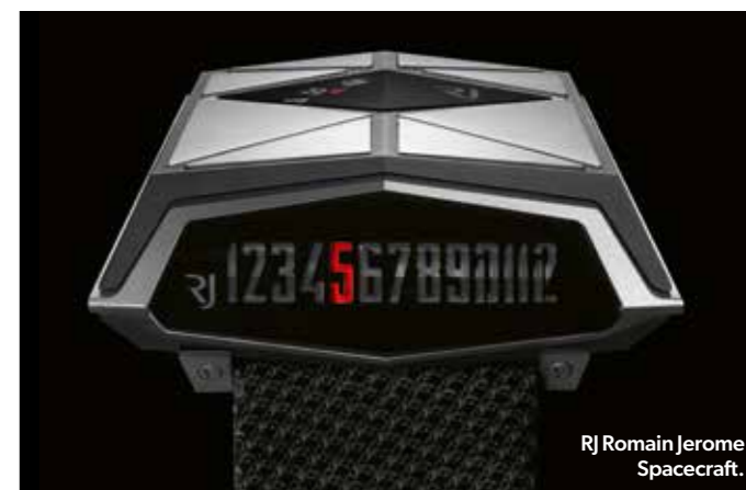
RJ Romain Jerome Spacecraft.