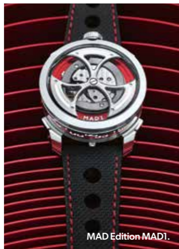
MAD Edition MAD1.